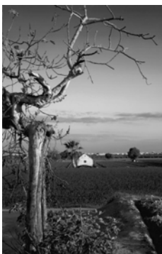
Primer premi (2007) Col·lectiu CAV 2n ESO IES "Vicent A. Estellés" de Burjassot